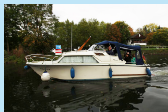
Alle Mädels an Bord der Phönix