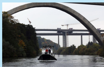
Voll besetzt: das Schiff Domion

Nach Ankunft in Dehrn wurde bei Kaffee, Kuchen und Deftigem der Abschluss der Saison gefeiert. 30 Mitglieder und Angehörige feierten ausgelassen.